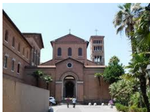
Convento e Chiesa di S. Anselmo Progettazione e direzione lavori di restauro campanile e convento dal 1995